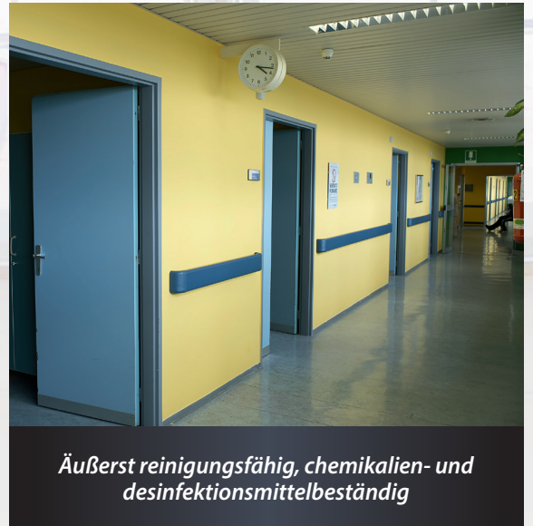
Äußerst reinigungsfähig, chemikalien- und desinfektionsmittelbeständig