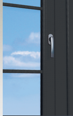
Direkter Auftrag auf Ha...