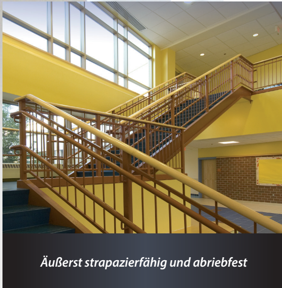
Äußerst strapazierfähig und abriebfest