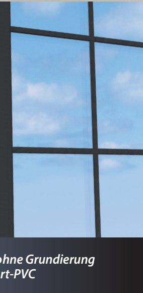
ohne Grundierung auf Hart-PVC