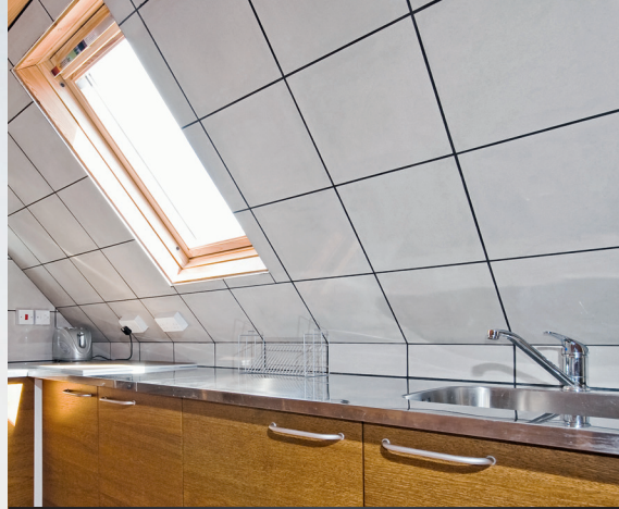
In Verbindung mit Premium 2K Epoxi-Haftgrund die saubere und schnelle Alternative zur Fliesenrenovierung